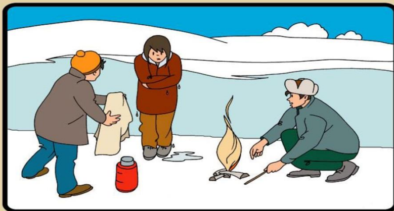
ДАЙТЕ ПОСТРАДАВШЕМУ ЧАСТЬ СВОЕЙ ОДЕЖДЫ. РАЗВЕДИТЕ КОСТЕР И ОБОГРЕЙТЕ ПОСТРАДАВШЕГО. ВЫЗОВИТЕ СПАСАТЕЛЕЙ ИЛИ «СКОРУЮ ПОМОЩЬ».