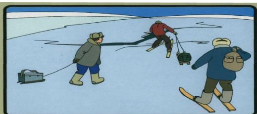
ПЕРЕДВИГАЯСЬ ПО ЛЬДУ БУДЬТЕ ВСЕГДА ГОТОВЫ НЕМЕДЛЕННО ОСВОБОДИТЬСЯ ОТ ГРУЗА!

Запомни! Не наматывай веревку на руку – пострадавший может утянуть и тебя в полынью.