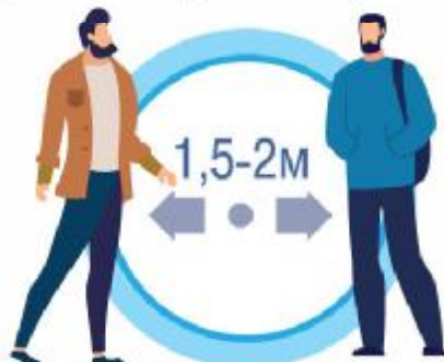
СОБЛЮДАЙТЕ РАССТОЯНИЕ И ЭТИКЕТ